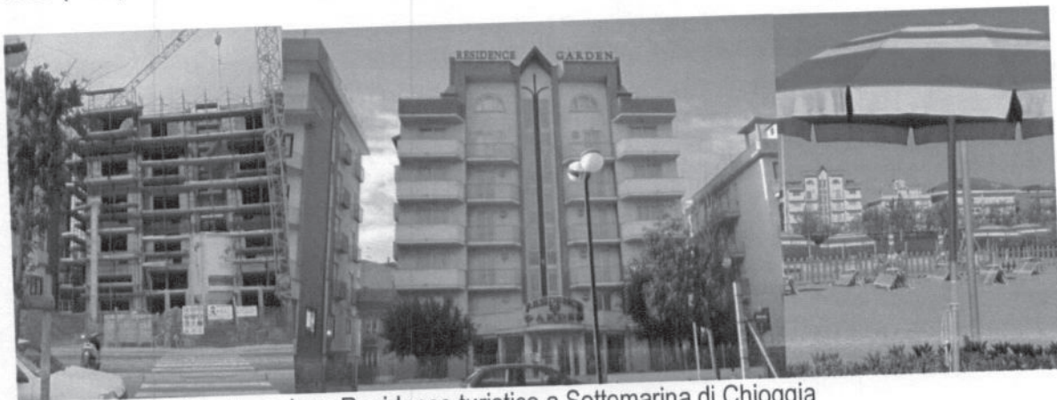
2004 (finito) – Ristrutturazione Residence turistico a Sottomarina di Chioggia