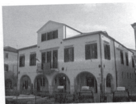
2000 (finito) – Restauro con cambio d'uso di Palazzo Ravagnan in Centro Storico a Chioggia