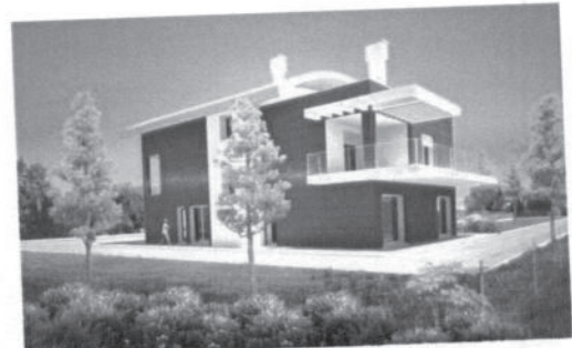
2011 (progetto in fase di rilascio) - Nuova costruzione Villa con laboratorio artigianale in Chioggia