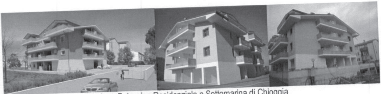
2007 (finita) - Nuova costruzione Palazzina Residenziale a Sottomarina di Chioggia