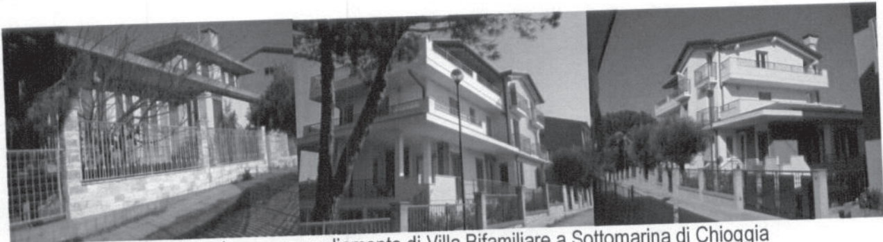
2006 (finita) – Ristrutturazione con ampliamento di Villa Bifamiliare a Sottomarina di Chioggia