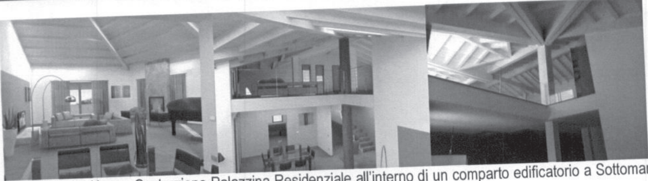
2008 (finita) - Nuova Costruzione Palazzina Residenziale all'interno di un comparto edificatorio a Sottomarina di Chioggia