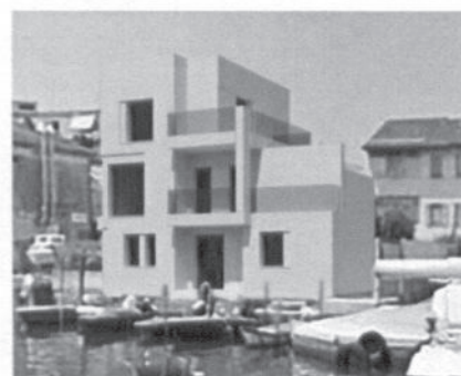
2015 (progetto rilasciato in fase di realizzazione) – Demolizione e ricostruzione con ampliamento di edificio ad uso residenziale