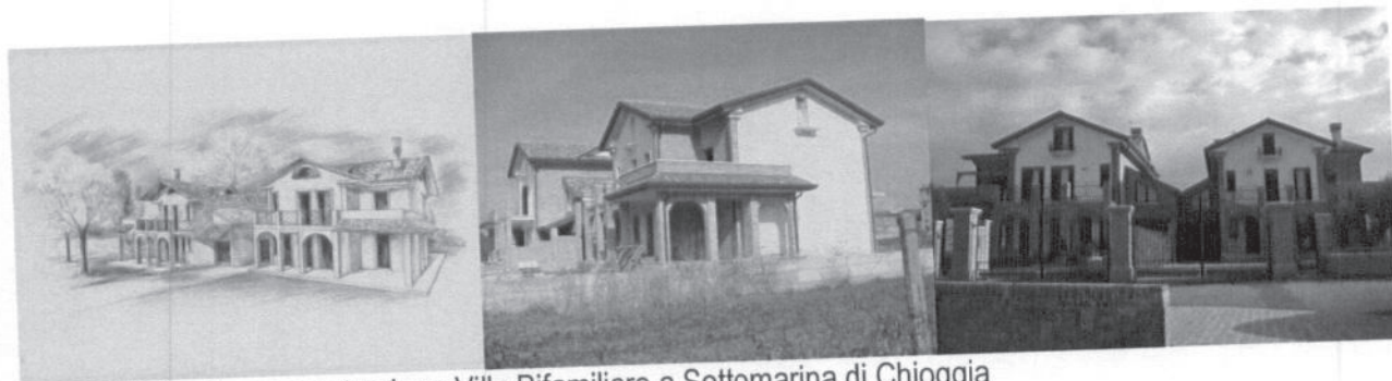
2005 (finita) – Nuova costruzione Villa Bifamiliare a Sottomarina di Chioggia