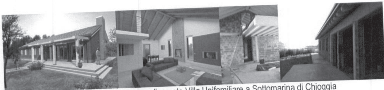
2009 (in corso) - Ristrutturazione con ampliamento Villa Unifamiliare a Sottomarina di Chioggia