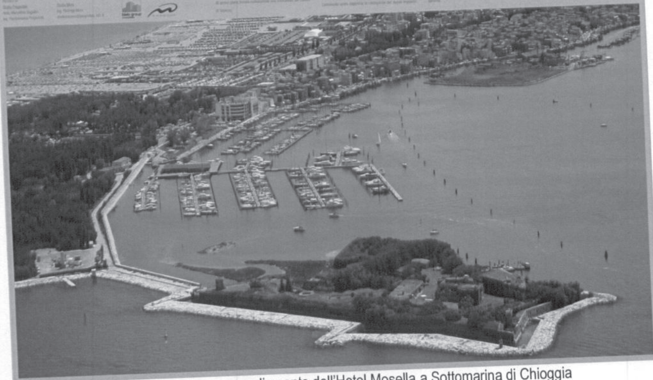
2007 (in corso) - Ristrutturazione con ampliamento dell'Hotel Mosella a Sottomarina di Chioggia

Il nuovo progetto, infatti, prevede anche una struttura di ampio respiro, in grado di ospitare oltre 1000 posti letto, in grado di soddisfare le esigenze di chi si reca in vacanza a Sottomarina di Chioggia e di chi si reca in città.