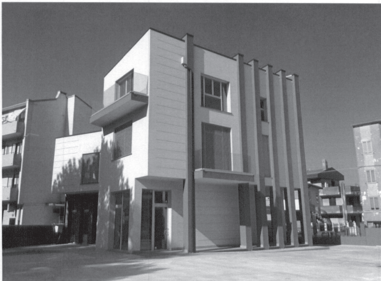
2013-2015 (progetto completato) – Ristrutturazione con ampliamento di edificio ad uso commerciale/produttivo