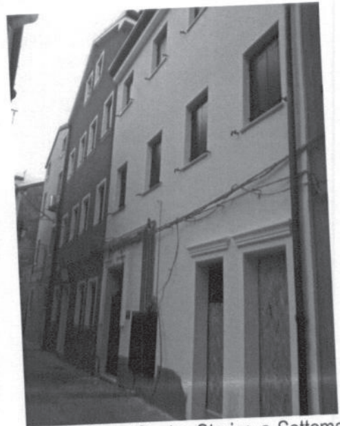
2008 (finito) - Piano di recupero e Ristrutturazione di edificio residenziale in Centro Storico a Sottomarina di Chioggia